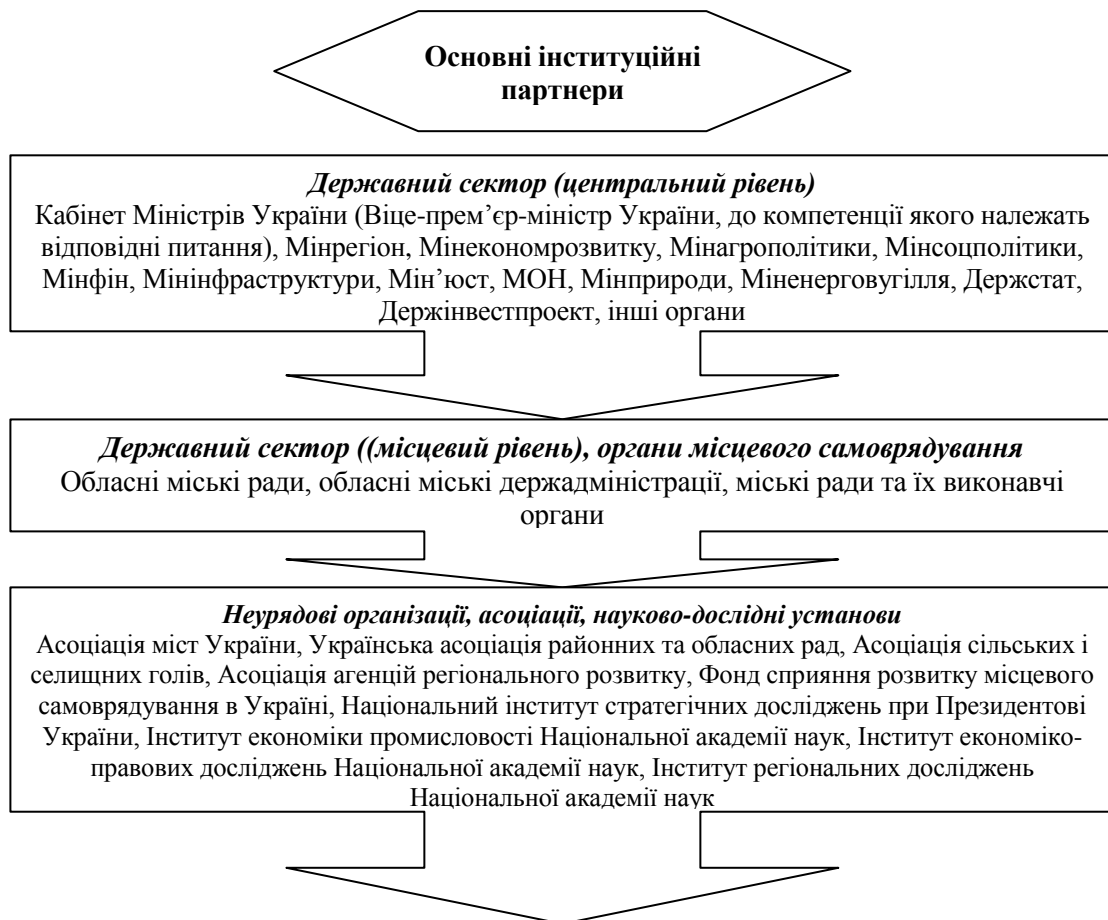
Рис. 1. Основні інституційні партнери реалізації Державної стратегії регіонального розвитку на період до 2020 року

Встановлено, що першочерговим документом держави щодо сільського розвитку є Єдина комплексна стратегія, а в основі більшості програм регіонального рівня закладена Стратегія регіонального розвитку на період до 2020 року. Основні інституційні партнери даної Стратегії наведено на рис. 1.