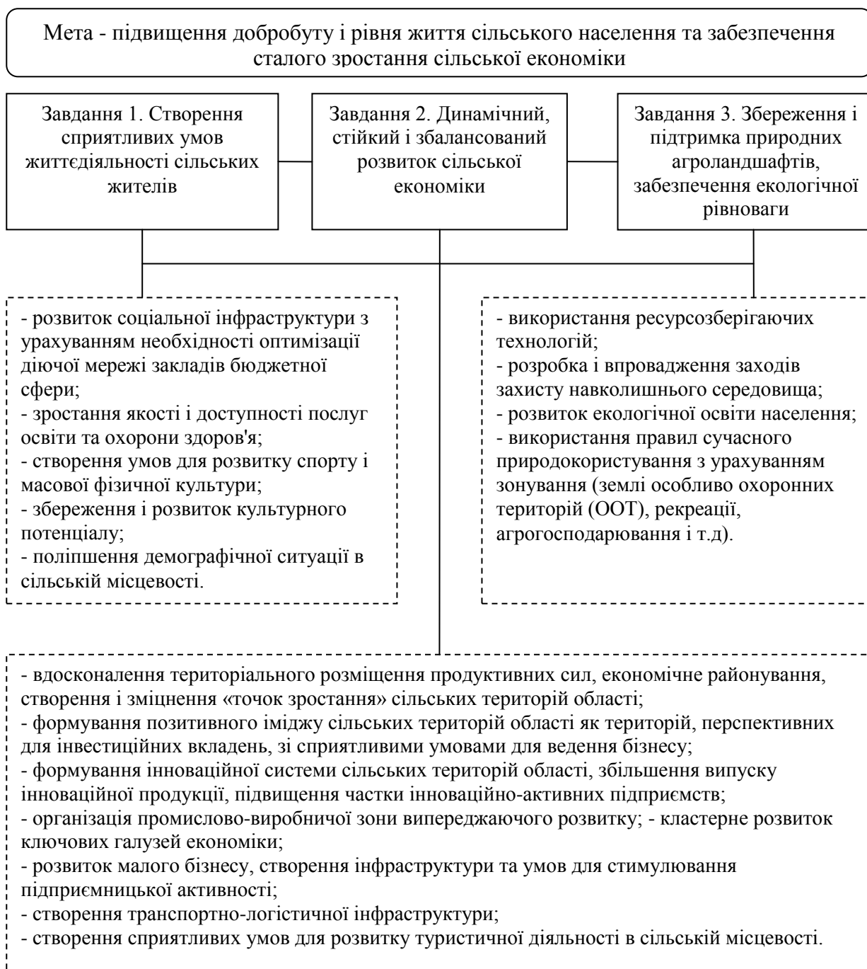
Рис. 3. Дерево цілей і завдань регіональної політики стійкого сільського розвитку

При визначенні системи заходів і заходів політики стійкого сільського розвитку необхідно враховувати інтереси всіх груп інтересів, яких безліч (рис. 4).